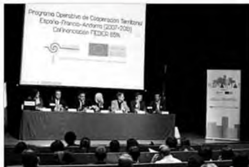
En el seminario participaron más de 90 profesionales.

El proyecto ha sido financiado a un 65% por los fondos Feder. Todas las partes implicadas se mostraron optimistas a la hora de recibir nuevos fondos. En todo caso, mantendrán la colaboración en materia de rehabilitación urbana de cara al futuro.