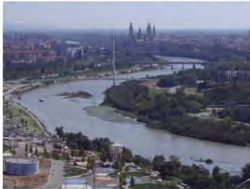
El proyecto europeo Rehabitat dibuja en Zaragoza su ciudad ideal

El proyecto europeo Rehabitat se ha clausurado con el impulso de la puesta en marcha una plataforma en Red para el Intercambio de Experiencias y Buenas Prácticas Rehabitat. Con el acento puesto en el factor humano, autoridades y técnicos españoles y franceses han valorado los tres años de cooperación que esperan retomar en 2014.