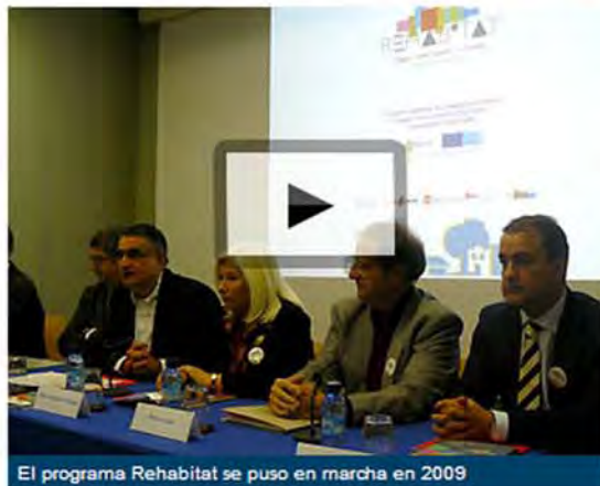
El programa Rehabitat se puso en marcha en 2009

Zaragoza.- Cerca de 300 viviendas públicas en la zona del Gabriela Mistral del barrio Oliver y otro medio centenar en Peñetas, Miralbueno. Es el resultado del programa internacional Rehabitat gracias al que, además, se han rehabilitado las zonas comunes de estos sectores. En este proyecto, que comenzó en 2009 y finaliza ahora, han participado Toulouse, Aureilhan, Cataluña, Bilbao y Zaragoza.